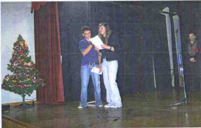
Los encargados de presentar el concurso fueron miembros de la Agrupación Cultural Ciudad de Wamba

No podía faltar en estas fechas el tradicional concurso de villancicos que desde la Concejalía de Cultura del Excmo. Ayuntamiento de la localidad se lleva a cabo a finales de año. En esta ocasión se celebró el día 29 de diciembre en el Salón de Actos de la Casa de la Cultura. Los grupos que participaron este año fueron en la categoría infantil, La Chispa de la Navidad de Cabeza la Vaca y en la categoría de adultos, el Coro Amigos del Camino de Fuente de Cantos, la Asociación Cultural "Coral Gran Maestre" de Fuente del Maestre, el Coro de Bienvenida y el Coro Cante y Jarana de Sevilla. Este acto es una cita ineludible para los vecinos y turistas de Cabeza la Vaca que acuden al espectáculo para disfrutar de las maravillosas voces que cantan los villancicos