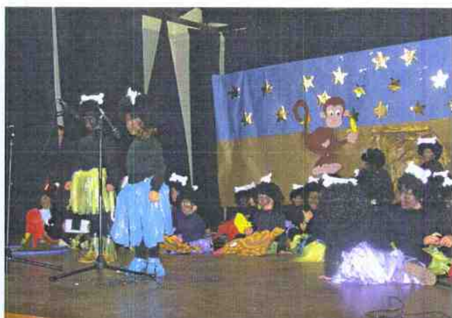
Los tres cursos de Infantil actuaron juntos

Con motivo de la llegada de las vacaciones navideñas, los alumnos del Colegio Público María Inmaculada de Cabeza la Vaca, realizaron el 19 de diciembre una actuación en el Salón de Actos de la Casa de la Cultura. Todos los cursos de Educación Infantil y Primaria actuaron, algunos realizaron teatros de navidad, otros cantaron villancicos y otros hicieron teatros cómicos lo que hizo que el público asistente se divirtiera con la actuación de los pequeños.