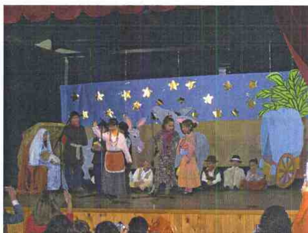
Algunos miembros de la AMPA y los profesores participaron también y cantaron un villancico como cierre de la actuación del colegio.