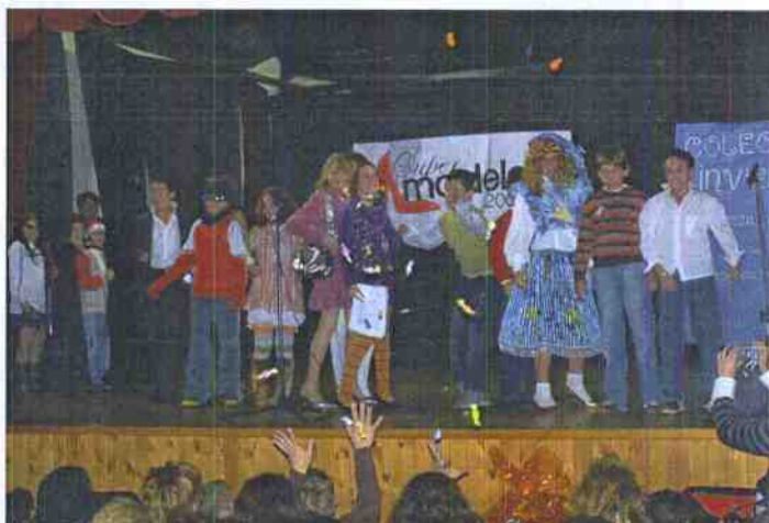
Los cursos de alumnos más mayores optaron por hacer un divertido teatro cómico o cantar un bonito villancico