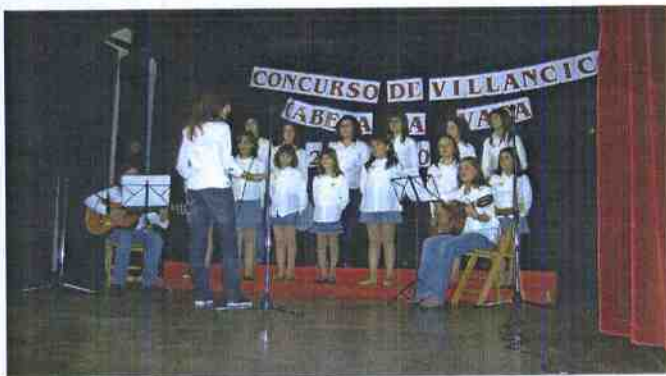
En la Categoría infantil participó el grupo local, "La Chispa de la Navidad" que se alzó con el primer y único premio